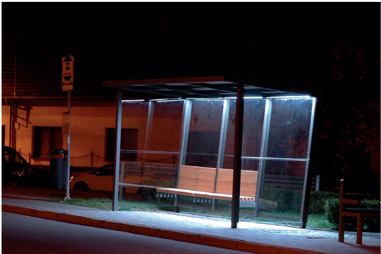
přístřešek Uhlyk vybavený osvětlením