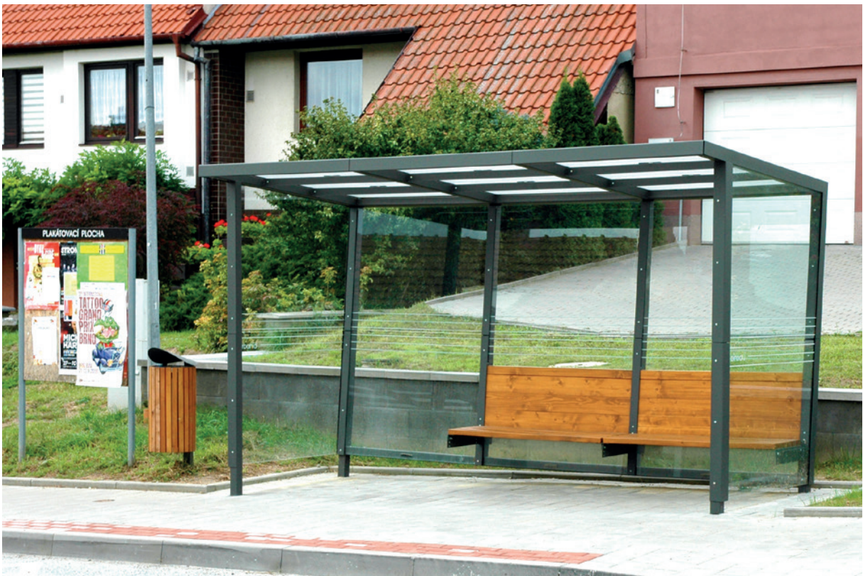
třímodulová čekárna s širokými bočnicemi a dvěma lavičkami umístěnými na pravé straně