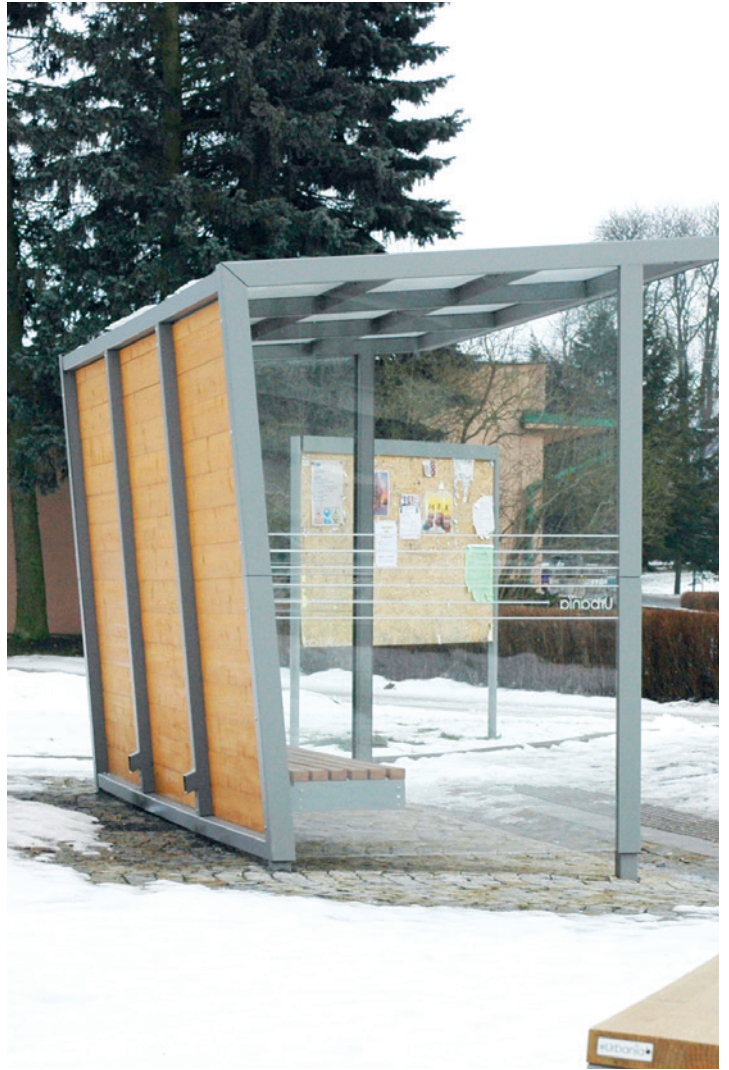
rozstřikování vody ze střechy je zamezeno svodem vody zadními stojinami