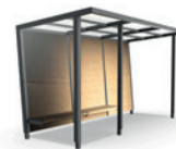
široké bočnice a přední zástěna