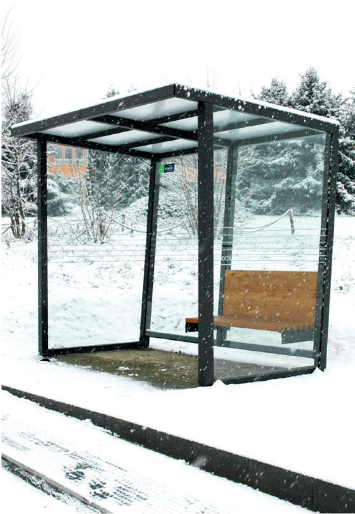
přístřešek Uhlyk má sněhový posudek až do sněhové oblasti č. 6