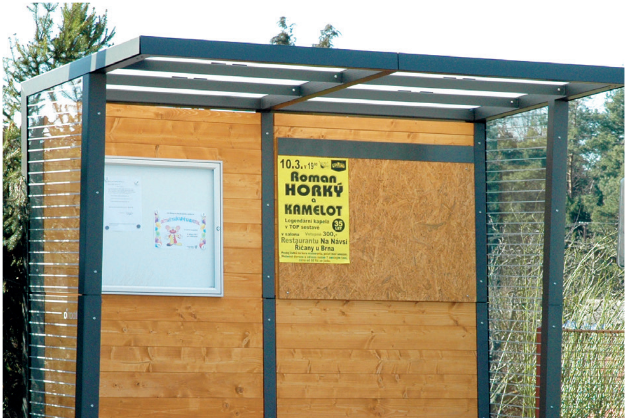
vitrína a plakátovací plocha, úzké bočnice s celoplošným polepem