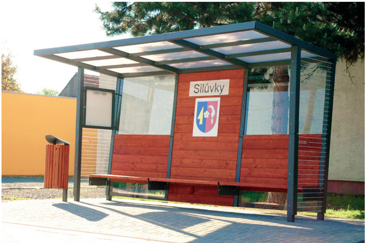
přístřešek v kombinaci dřeva a sklo, nápis a znak na dřevěné výplni, na boční stěně vitrina, vedle odpadkový koš Tubo