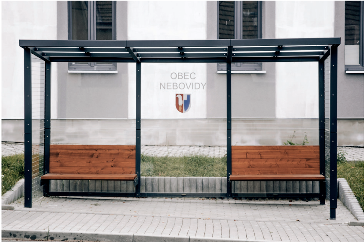
lavičky umístěné po stranách, název a znak obce aplikované na skle