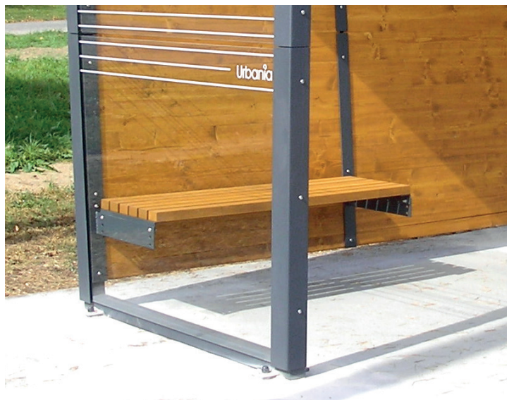
lze využít i stávající betonovu patku staré čekárny a ukotvit přístřešek na povrch