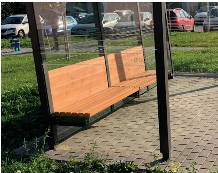
čekárna Uhlyk může být ukotvena pod povrch