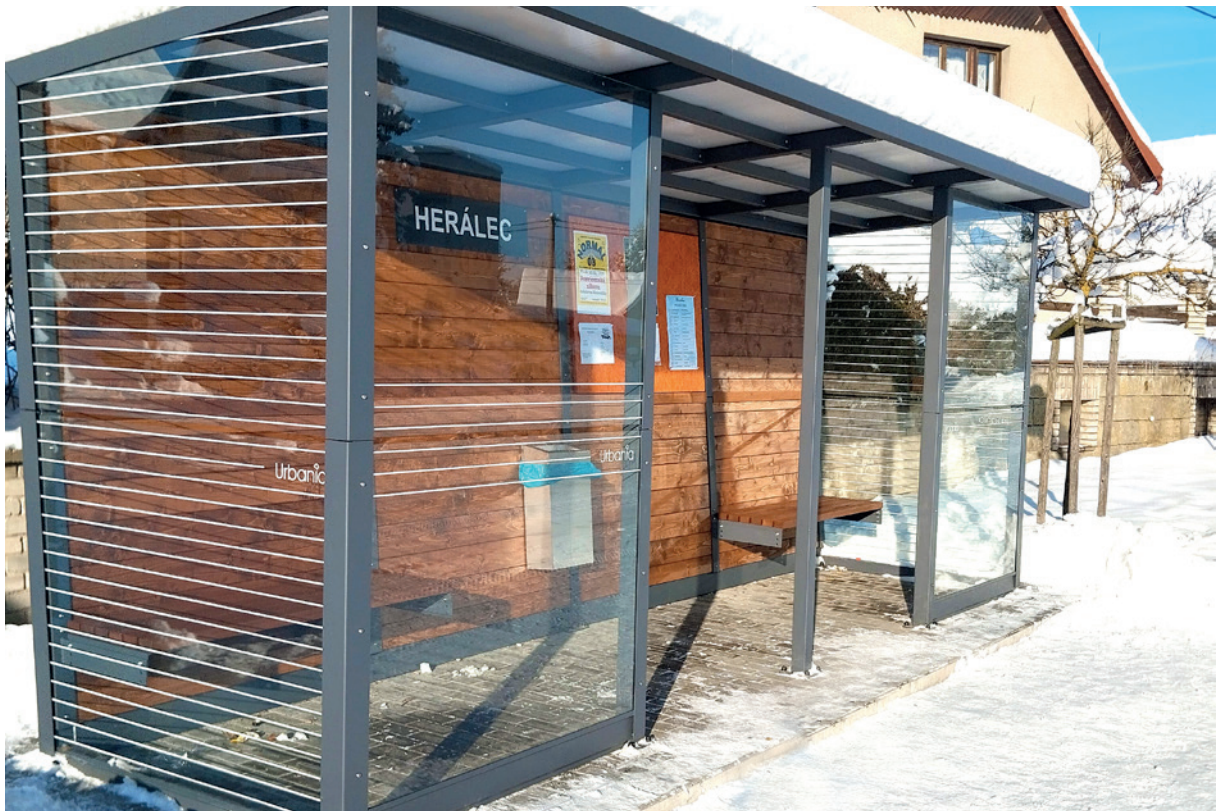
čtyřmodulová varianta, dvě přední zástěny, na zadní stěně plakátovací plocha a nápis, bočnice s celoplošným polepem pro bezpečí ptáků