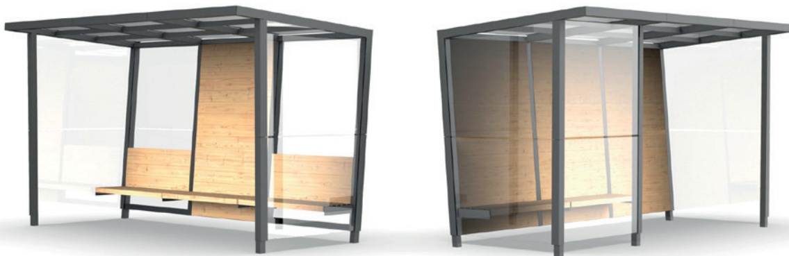
přístřešek s kombinovanými zadními výplněmi dřevo i sklo a přístřešek s přední zástěnou