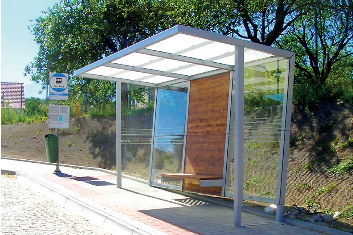
varianta s úzkými bočnicemi , kde středový modul s lavičkou je ze dřeva, ostatní výplně skleněné