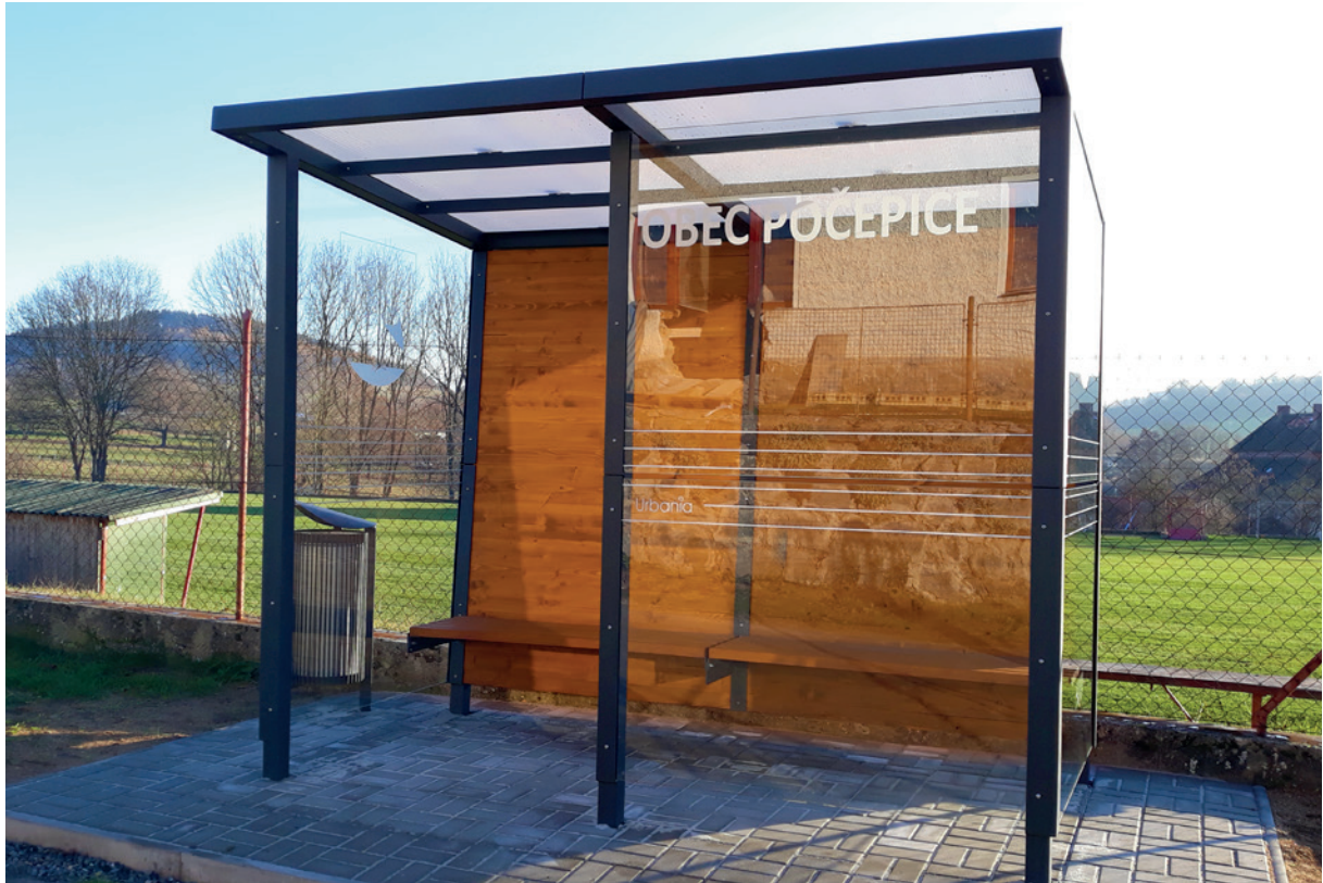
dvoumodulový přístřešek s přední zástěnou, na které je nápis, zadní výplně dřevěné, lavička přes celou šířku