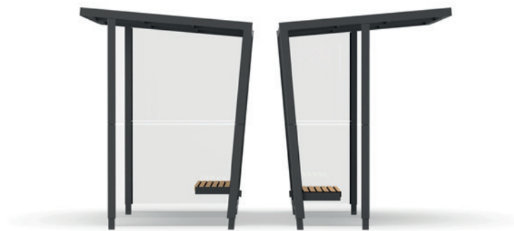
dvoumodulové přístřešky - bočnice standardní šířky a zúžené