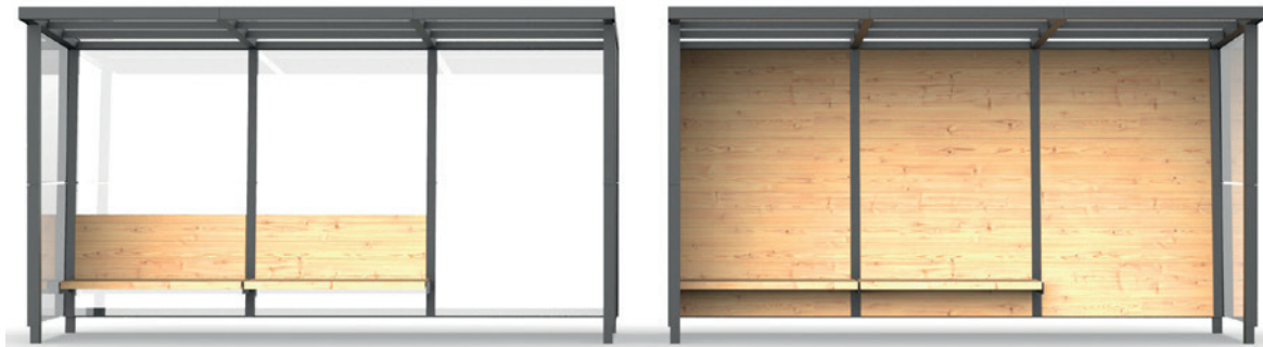
třimodulové přístřešky Uhlyk - zadní výplně ze skla a ze dřeva