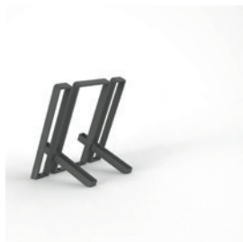
SK.IK.2 pro 2 kola