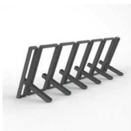
SK.IK.6 pro 6 kol