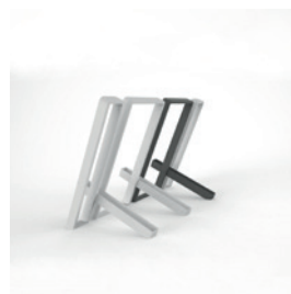
SK.IK.R rozšíření stojanu