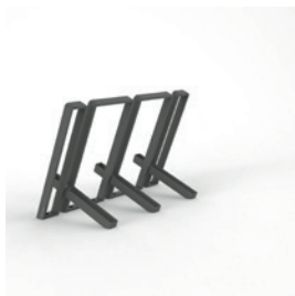
SK.IK.3 pro 3 kola